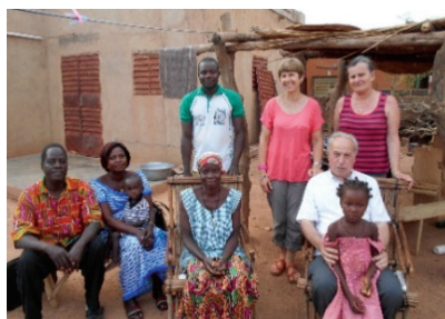
Été 2016 : délégation diocésaine à Ouahigouya