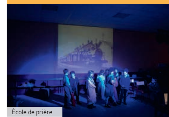
École de prière