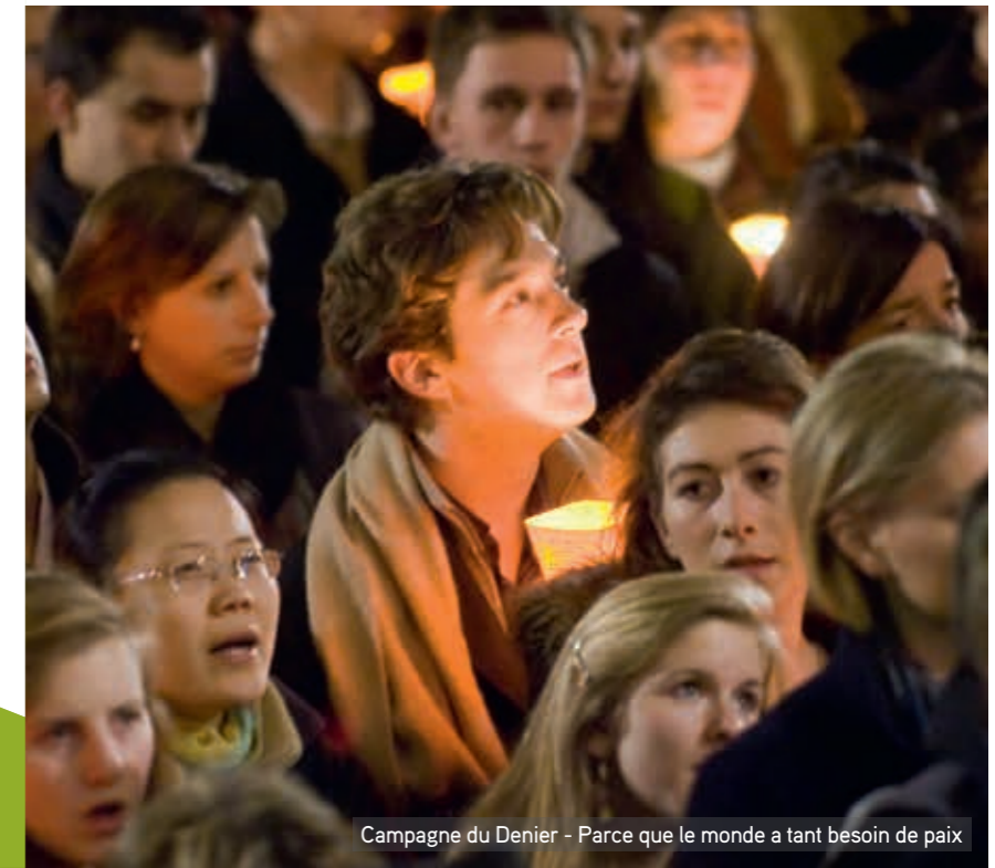
Campagne du Denier - Parce que le monde a tant besoin de paix