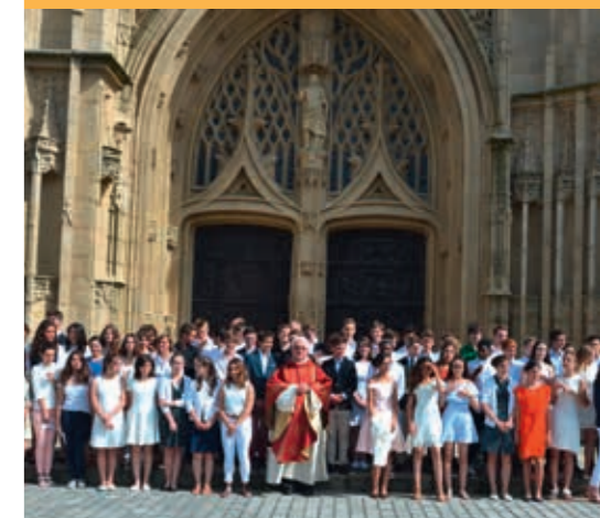
Confirmation des jeunes