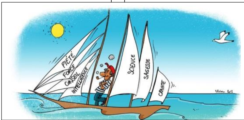
LES SEPT DONNÉS DE L'ESPRIT SAINT