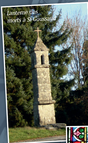
Lanterne des morts à St Goussaud