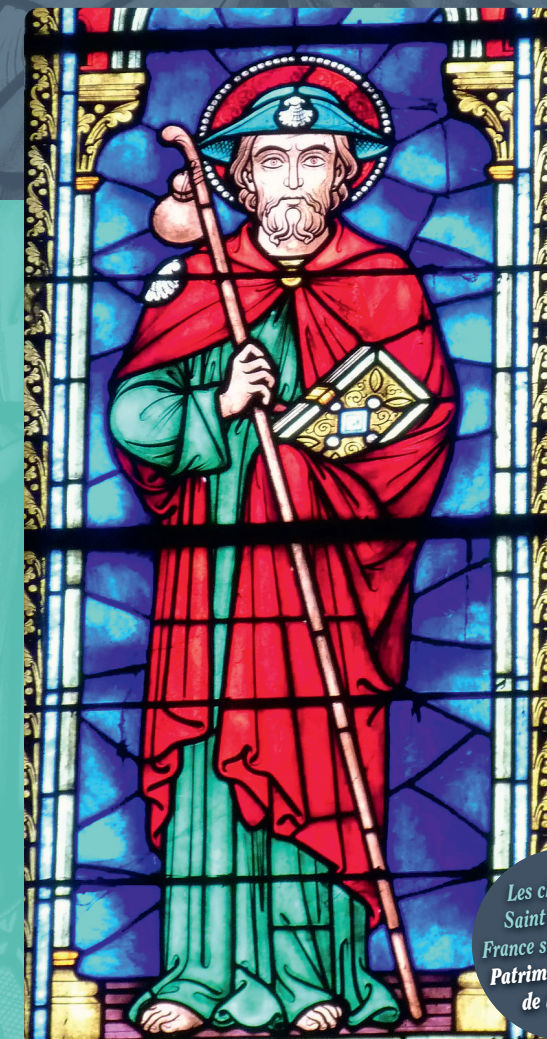
(Vitrail de l'Église de La Souterraine)

Les chemins de Saint Jacques en France sont inscrits au Patrimoine Mondial de l'UNESCO