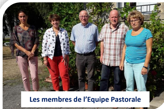
Les membres de l'Equipe Pastorale

Paroisse Saint-Eloi-des-Hauts-de- l'Aurence