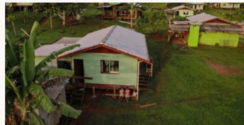
Village déplacé, Vunidogoloa, îles Fidji. Juillet 2022

mot qui signifie un "retour", en l'occurrence vers Dieu. À cette époque, les gens, et surtout les dirigeants, se contentaient de dire qu'ils étaient des enfants d'Abraham sans mettre en pratique ce qu'Abraham avait façonné pour eux. Aujourd'hui, nous sommes confrontés à une situation très similaire, voire même critique, en raison des dommages environnementaux dûs à l'activité humaine. Et pourtant, que font nos dirigeants, notre peuple ? Le monde occidental se réclame de l'héritage judéo-