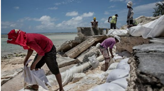
La population locale est régulièrement obligée de réparer les routes abîmées par les inondations sur les îles de la République des Kiribati.

L'État insulaire des Kiribati, responsable de seulement 0,6 % des émissions mondiales de gaz à effet de serre, a déjà perdu deux de ses îles inhabitées, Abanuea et Tebua Tarawa, en raison de l'élévation du niveau des mers.